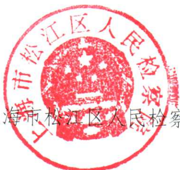
上海市松江区人民检察院