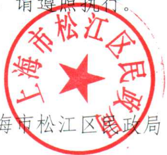
上海市松江区邮政局