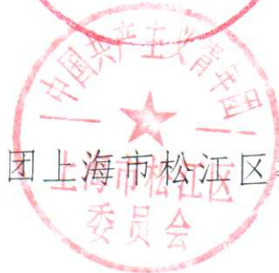
共青团上海市松江区委员会