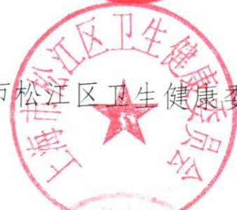
上海市松江区卫生健康委员会