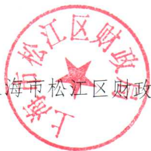
上海市松江区财政局