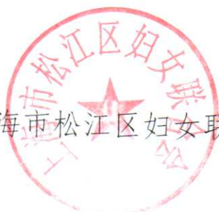
上海市松江区妇女联合会